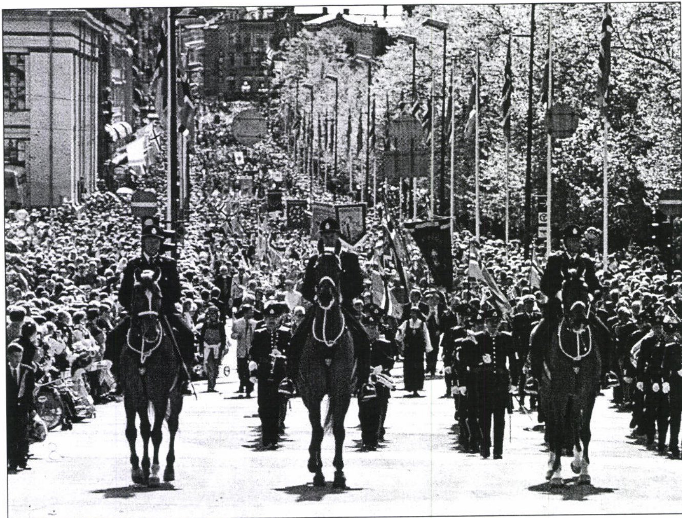
El 17 de mayo, día de fiesta por excelencia: la policía de Oslo, montada en sus magníficos caballos, caracolea a la cabeza de un desfile compuesto aproximadamente por 10.000 escolares, en la arteria principal de la capital, la avenida de Karl Johan.

da tanto en países protestantes como en países católicos. Los primeros huevos pintados de colores que se conocen proceden de la Corte inglesa del siglo XIII. En la Edad Media, la Iglesia resolvió que el huevo sería el símbolo oficial de la resurrección de Cristo. Esto hizo que la Iglesia bendijera huevos durante la Pascua y que la gente se sirviera de ellos con fines religiosos y mágicos. Después de la Reforma, se prohibió a la Iglesia bendecir huevos en Pascua, pero en la imaginería simbólica popular el huevo continuaba simbolizando la fuerza y la fecundidad.